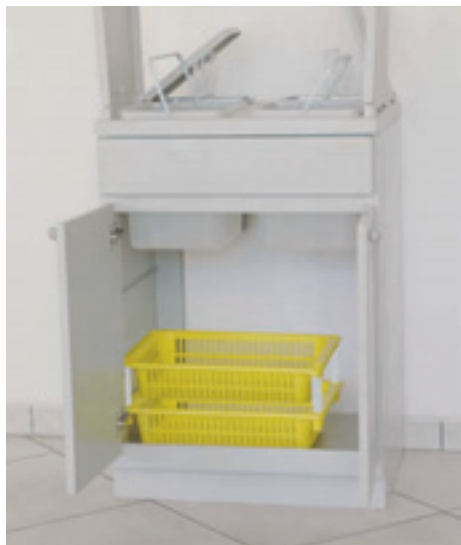
Cestello a richiesta Optional basket