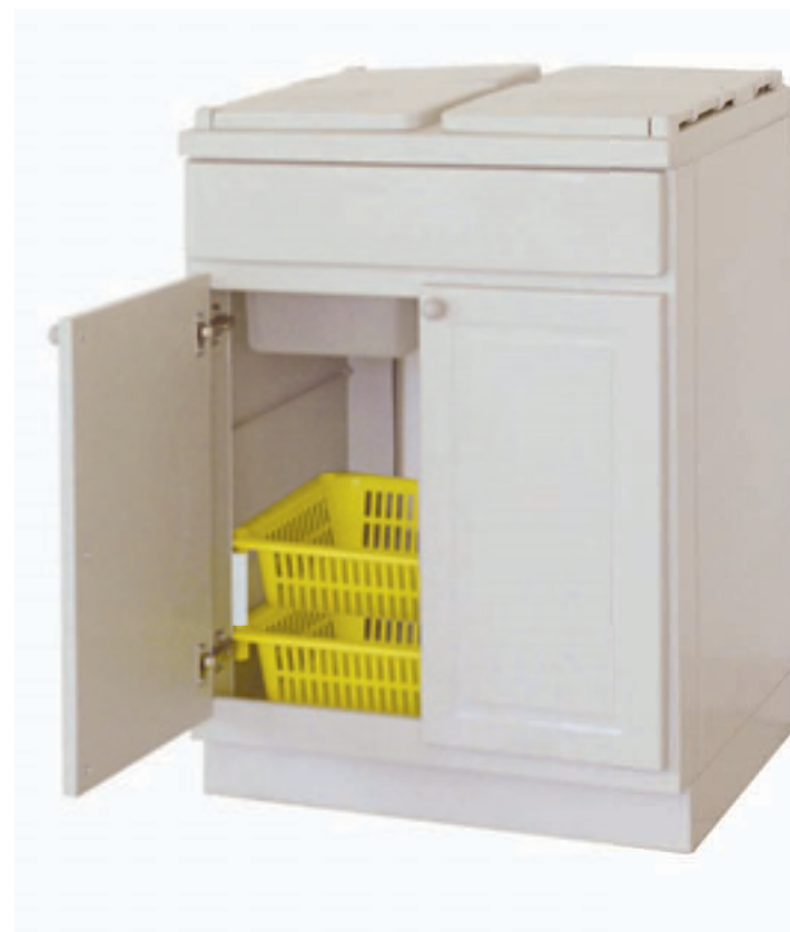
Cestello a richiesta Optional basket

Base for the differentiated home trash, entirely built in plastic material. cm. 59 x 50 x 85 h.