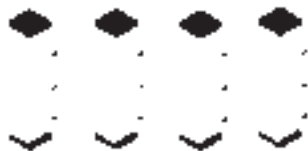
Tiriciclo cm. 32 X 32 X 164 H.